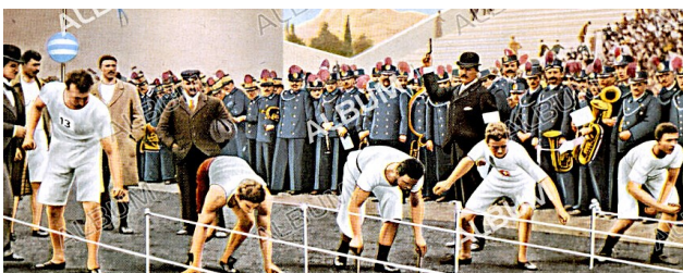
J. O. d'Athènes, 1896, départ du 100 m ...!