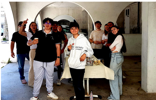
Les futurs Anciens