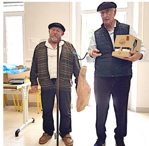
Nos joyeux animateurs